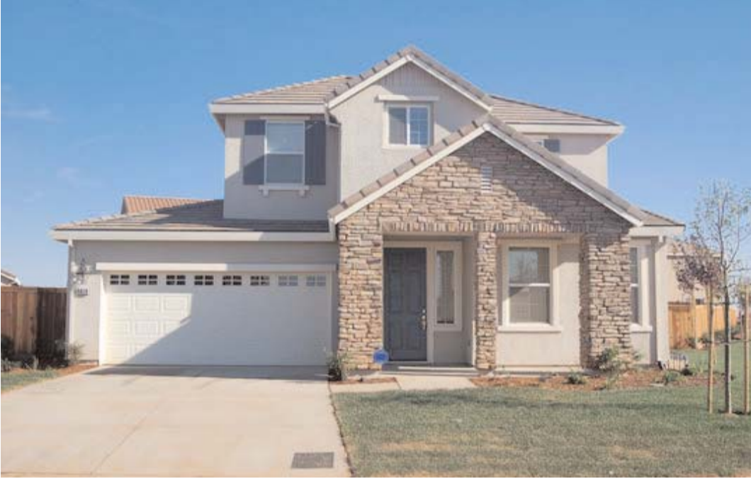
నివసించే పేద, అల్లు ఆదాయ, మధ్యతరగతి వర్గాల వారికి అందుబాటులో తక్కువ ధరలకే ఇళ్లను అందించేందుకు సర్కార్ రెడీ అయింది. ఈ మేరకు ఎఫ్.ఐ.ఐ. హౌసింగ్ పాలసీని తెలంగాణ ప్రభుత్వం సిద్ధం చేస్తోంది. ఈ నెలాఖరులోగా అందుకు సంబంధించిన మార్గదర్శకాల ముసాయిదాను రేవెంట్ ప్రభుత్వం రూపొందించనుంది. ఈ మేరకు పాలసీ రూపకల్పనకు 'రికెస్ట్ ఫర్ ప్రపోజల్' ద్వారా సీపీఐఐఐ కన్సల్టెన్సీ సంస్థను ఎంపిక చేసింది. మొత్తం మూడు

హైదరాబాద్ : హైదరాబాద్ నగరంలో సొంతిల్లు కట్టుకోవాలనుకునే మధ్యతరగతి ప్రజలకు తెలంగాణ ప్రభుత్వం తీవ్ర కబురు చెప్పింది. ప్రజల సొంతింటి కలను నిజం చేసేందుకు హైదరాబాద్ ఔటర్ రింగు రోడ్డు, రీజినల్ రింగు రోడ్డు మధ్య మిడిల్ క్లాస్ ప్రజలకు తక్కువ ధరకే ఇళ్లు నిర్మించి ఇస్తామని మంత్రి పొంగులేటి శ్రీనివాస్ రెడ్డి తెలిపారు. కూకట్‌పల్లి హౌసింగ్ బోర్డు తరహాలో ఈ ఇళ్ల నిర్మాణం ఉంటుందని అన్నారు. హైదరాబాద్ నగరంలో లేదా శివారు ప్రాంతంలో ఇల్లు కట్టుకోవాలని మధ్య తరగతి ప్రజలు కలలు కంటుంటారు. అయితే ప్రస్తుతం ఇళ్ల ధరలు అకాశానికి చేరుకున్నాయి. శివారు ప్రాంతాల్లోనూ ఇళ్ల ధరలు లక్షల్లో పలుకుతున్నాయి. దాదాపు రూ. 60-70 లక్షలు వెచ్చించినా ఇల్లు దొరకని పరిస్థితి. ఈ నేపథ్యంలో మిడిల్ క్లాస్ ప్రజల సొంతింటి కలను నిజం చేసేందుకు రేవెంట్ సర్కార్ సిద్దమైంది. ఈ మేరకు గృహనిర్మాణ శాఖ మంత్రి పొంగులేటి శ్రీనివాస్ రెడ్డి అధికారులకు కీలక ఆదేశాలు జారీ చేశారు. హైదరాబాద్ రీజినల్ రింగు రోడ్డు - ఔటర్ రింగు రోడ్డు పరిధిలో మధ్య తరగతి ప్రజల కోసం తక్కువ ధరకే ఇళ్లను నిర్మించి ఇస్తామని పొంగులేటి వెల్లడించారు. హైదరాబాద్ కోర్ అర్బన్ రీజియన్ ఎకానమీ (క్యూఆర్) పరిధిలో హౌసింగ్ పాలసీపై మంగళవారం అధికారులతో సమీక్ష నిర్వహించిన పొంగులేటి గతంలో కేపీహెచ్.ఐ.లో నిర్మించిన మార్కెటింగ్ ఇళ్లను నిర్మించి ఇస్తామన్నారు. ఇందుకోసం నాలుగు ప్రాంతాల్లో స్థలాలను గుర్తించి పది రోజుల్లో నివేదిక అందించాలని అధికారులను ఆదేశించారు. కాగా, కనీసం వంద ఎకరాల్లో ఈ టౌన్షిప్‌ను అందుబాటులో తేవాలన్నదే తమ ప్రభుత్వ లక్ష్యమని గతంలోనే మంత్రి పొంగులేటి తెలిపారు. ఇక రాష్ట్రంలోని పట్టణాలు, నగరాల్లో