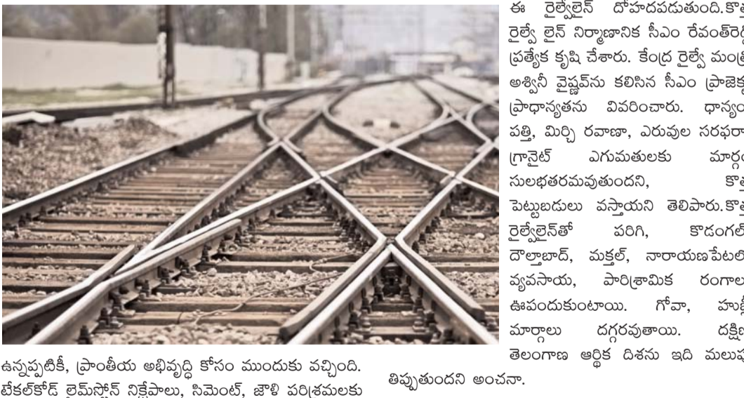
ఉన్నప్పటికీ, ప్రాంతీయ అభివృద్ధి కోసం ముందుకు వచ్చింది. టెక్నోకాన్ రైమ్ స్టోన్స్ నిక్షేపాలు, సిమెంట్, జౌళి పరిశ్రమలకు తిప్పుతుందని అంచనా.

హైదరాబాద్ : కేంద్రంలో ఎన్ని ప్రభుత్వాలు మారుతున్న తెలుగు రాష్ట్రాల్లో రైల్వే లైన్ విస్తరణ అశించిన స్థాయిలో జరగడం లేదు. నిడుల కేటాయింపులో వివక్ష చూపుతున్నాయన్న విమర్శలు ఉన్నాయి. అయితే బీజేపీ అధికారంలోకి వచ్చిన తర్వాత రైల్వే కన్నా రోడ్డు విస్తరణపై దృష్టిపెట్టింది. ఇందులో భాగంగా అనేక రహదారులను జాతీయ రహదారులుగా మార్చింది. తాజాగా కొత్త రైల్వే లైన్ నిర్మాణానికి గ్రీన్ సిగ్నల్ ఇచ్చింది. దక్షిణ తెలంగాణ ప్రాంతాల అభివృద్ధికి కీలకమైన వికారాబాద్-కృష్ణా రైల్వే ప్రాజెక్టుకు సంబంధించిన సమగ్ర నివేదిక రైల్వే బోర్డుకు చేరింది. రూ. 2,750 కోట్ల వ్యయంతో 130.28 కిమీ దూరం విస్తరించిన ఈ మార్గం ఆమోదం పొందితే పరిగి, కొడంగల్, మక్తల్, నారాయణపేటలకు రైలు కనెక్టివిటీ వస్తుంది. తొలుత 120 కిమీగా డీపీఆర్ రూపొందించారు. తాజాగా 130.28 కిమీలకు పెంచారు. ఈ లైన్ భూసేకరణ ఖర్చు రాష్ట్రమే భరిస్తుంది. కేంద్రం ఆర్థిక లాభాలపై అభ్యంతరాలు