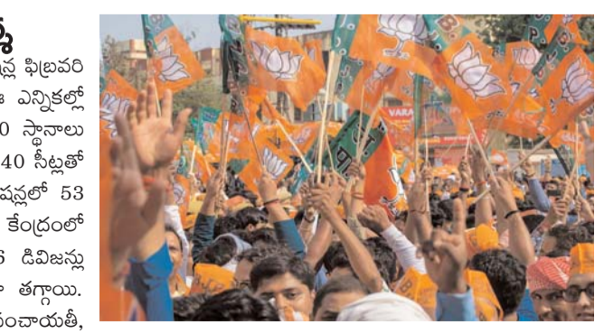
పార్టీగా, దేశ రక్షణ పార్టీగానే తెలంగాణ ప్రజలు చూస్తున్నారు. స్థానిక సమస్యలు పరిష్కరించే పార్టీగా భావించడం లేదు. ఈ విషయంపై బీజేపీ దృష్టి పెట్టాలి. బీజేపీ బలం తగ్గడం తెలంగాణతోపాటు, దేశ విషయాలపై ప్రజల అభిప్రాయాన్ని సూచిస్తుంది.

హైదరాబాద్ : తెలంగాణలో 116 మున్సిపాలిటీలు, 7 కార్పొరేషన్లు ఫిబ్రవరి 11న ఎన్నికలు జరిగాయి. 13న కౌంటింగ్ నిర్వహించారు. ఈ ఎన్నికల్లో కాంగ్రెస్ ఘన విజయం సాధించింది. 2,569 వార్డుల్లో 1,530 స్థానాలు గెలిచి పట్టణ రాజకీయాల్లో బలం చాటుకుంది. కార్పొరేషన్లలో 140 సీట్లతో ఆగ్రస్థానంలో నిలిచింది. ఇక బీజేపీ 781 వార్డులు, కార్పొరేషన్లలో 53 మాత్రమే గెలిచి ద్వితీయ స్థానంలో ఉంది. జాతీయ పార్టీ, కేంద్రంలో అధికారంలో ఉన్న బీజేపీ 245 వార్డులు, కార్పొరేషన్లలో 66 డివిజన్లు గెలిచింది. అయితే గతంలో పోలిస్సే బీజేపీ సీట్లు గజనీయంగా తగ్గాయి. ఎంపీలు, ఎమ్మెల్యే సీట్లు పెరిగినా... ఆ తర్వాత జరిగిన పంచాయతీ, మున్సిపల్ ఎన్నికల్లో బీజేపీ బలం తగ్గడం ఆత్మవిమర్శ చేసుకోవాల్సిన అవసరం ఉంది. ఇక మున్సిపల్ ఎన్నికల్లో 26 మున్సిపాలిటీల్లో ఎలాంటి పార్టీకి మెజారిటీ లేకపోవడంతో స్వతంత్రులు, వామపక్షులు కీలకం. కాంగ్రెస్ ఎక్కువ స్థానాలు సాధించేందుకు కొత్తవర్ష పూహలు రూపొందిస్తోంది. కాంగ్రెస్ పంచాయతీ విజయాల తర్వాత పట్టణాల్లో కూడా